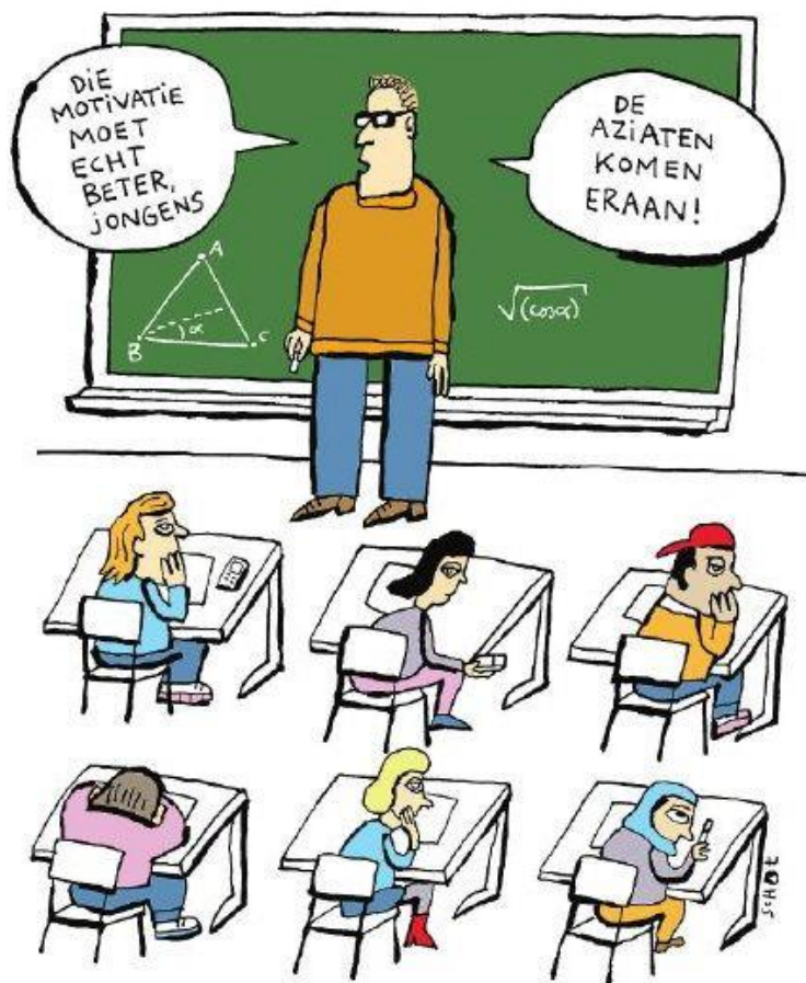
Illustratie Bas van der Schot

Un cop revisada la documentació aportada pels interessats i després de comprovar que reuneixen els requisits exigits, des dels Serveis Territorials/Consorti d'Educació de Barcelona, s'incorporarà, si escau, la documentació aportada a l'expedient del professorat i resoldrà la sol·licitud de reconeixement de l'acreditació del perfil.